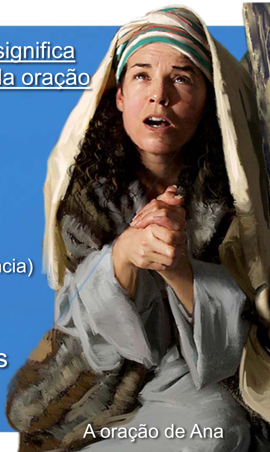
A oração de Ana